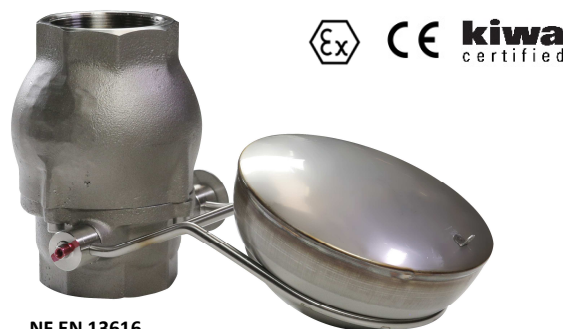
NF EN 13616