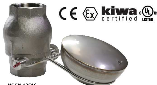
NF EN 13616

12 mois en respect des instructions de montage et d'utilisation.